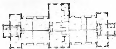
Plan parteru pałacu w Kozienicach.