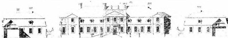
Widok z ogrodu pałacu w Kozienicach.