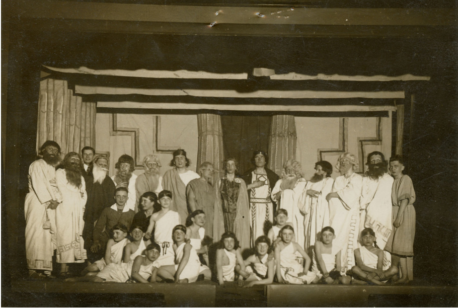
Fot. 2. Zdjęcie z przedstawienia teatralnego Król Edyp przygotowanego z okazji 50-lecia istnienia Towarzystwa Czytelniczego w Gimnazjum Mariackim, marzec 1928 r.

Na przestrzeni dziesięcioleci zmieniały się nazwy i program działania towarzystwa mającego na celu popularyzację książki i czytelnictwa. Pod koniec XIX w., występuje ono pod nazwą Deklamations-Verein der Gymnasiasten. Funkcjonowało również jako Gesang-und Deklamationsverein i Musik- und Leseverein 22 . Jak wskazuje nazwa – recytacje łączono z występami wokalnymi. Programy muzyczno-dramatyczne odbywały się częstokroć poza murami szkonymi. Gościny udzielał uczniom m.in. szczeciński Dom Koncertowy, co, zważywszy na rangę tej instytucji, może świadczyć o pewnym prestiżu, jakim cieszyły się szkolne organizacje w lokalnym środowisku 23 . Swoje podwoje udostępniały gimnazjalistom również inne szczecińskie instytucje i stowarzyszenia. Miejsca, w jakich prezentowali się członkowie koła poza szkołą,