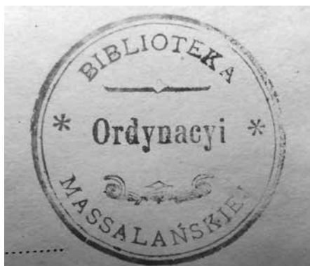
Fot. 2. Znak własnościowy Ordynacji Massalańskiej. Źródło: Grodzieńskie Państwowe Muzeum Historyczno-Archeologiczne, ( Pamiętniki Marcina Matuszewicza kasztelana Brzeskiego-Litewskiego 1714-1765, Warszawa 1876 – sygn. DRKiSD GPMHA, 096/00146).