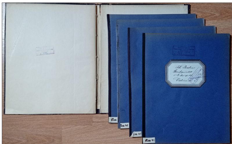
Fot. 5. Przykład postaci fizycznej Kwintetu op. 111 J. Brahmsa 42 , gdzie głos skrzypiec I stanowi teczkę dla pozostałych głosów.

Księgozbiór Dammego zachował się w bardzo dobrym stanie, choć w kilku utworach zagubione głosy bibliotekarze aMuz odtworzyli z innych, dostępnych wydań. Na każdym z druków przeprowadzono działania naprawcze, tzn. podklejono okładki na grubszym papierze lub sklejono kartki specjalistyczną taśmą. Pod względem postaci fizycznej są to w większości osobno oprawione głosy instrumentalne. W niektórych utworach jeden z głosów jest kodeksem posiadającym grubą obwolutę z poszerzonym grzbietem pełniącym funkcję teczki obejmującej pozostałe głosy (Fot. 5)